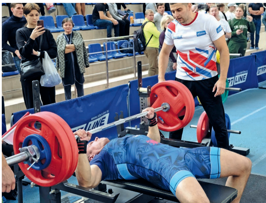
Первенство по классическому жиму на призы профсоюза работников Администрации ООО «Газпром трансгаз Томск» в спорткомплексе «Гармония»