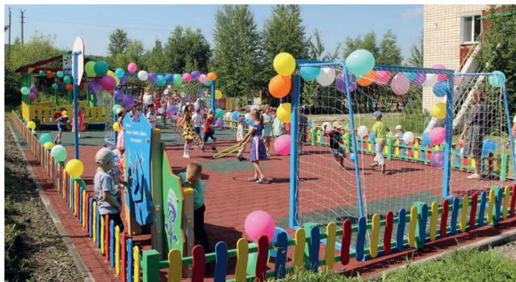
Спортивная площадка, г. Сквородино