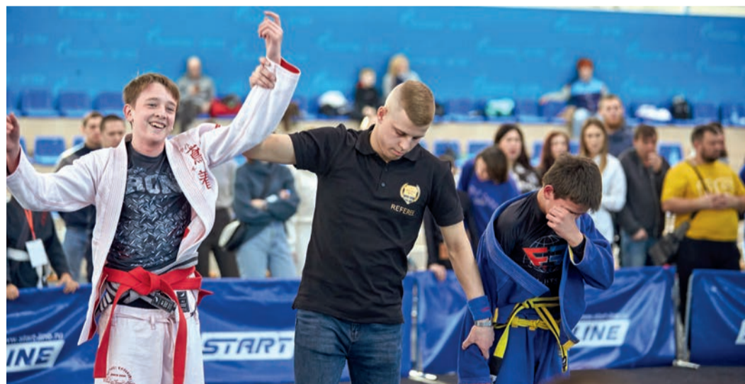
Радость победы и горечь поражения

25 февраля в томском спорткомплексе «Гармония» прошел турнир по бразильскому джиу-джитсу, организованный при поддержке ООО «Газпром трансгаз Томск».