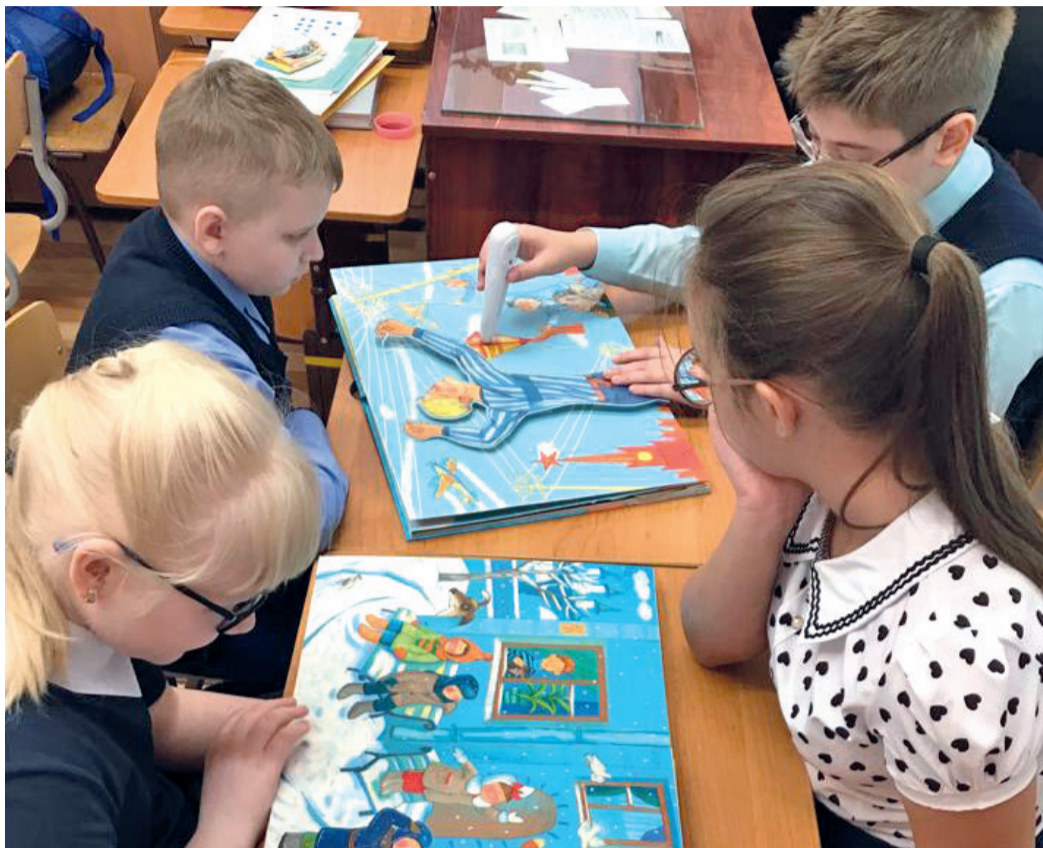
Подопечные коррекционной школы изучают подаренные газовиками тактильные книги

В 2022 году в центре внимания были детские дома, реабилитационные центры, специализированные учреждения школьного и дошкольного образования. В Сахалинской области благодаря газо-