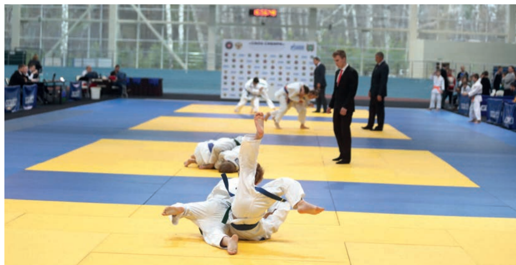
Межрегиональный турнир по дзюдо среди юношей и девушек на призы ООО «Газпром трансгаз Томск»