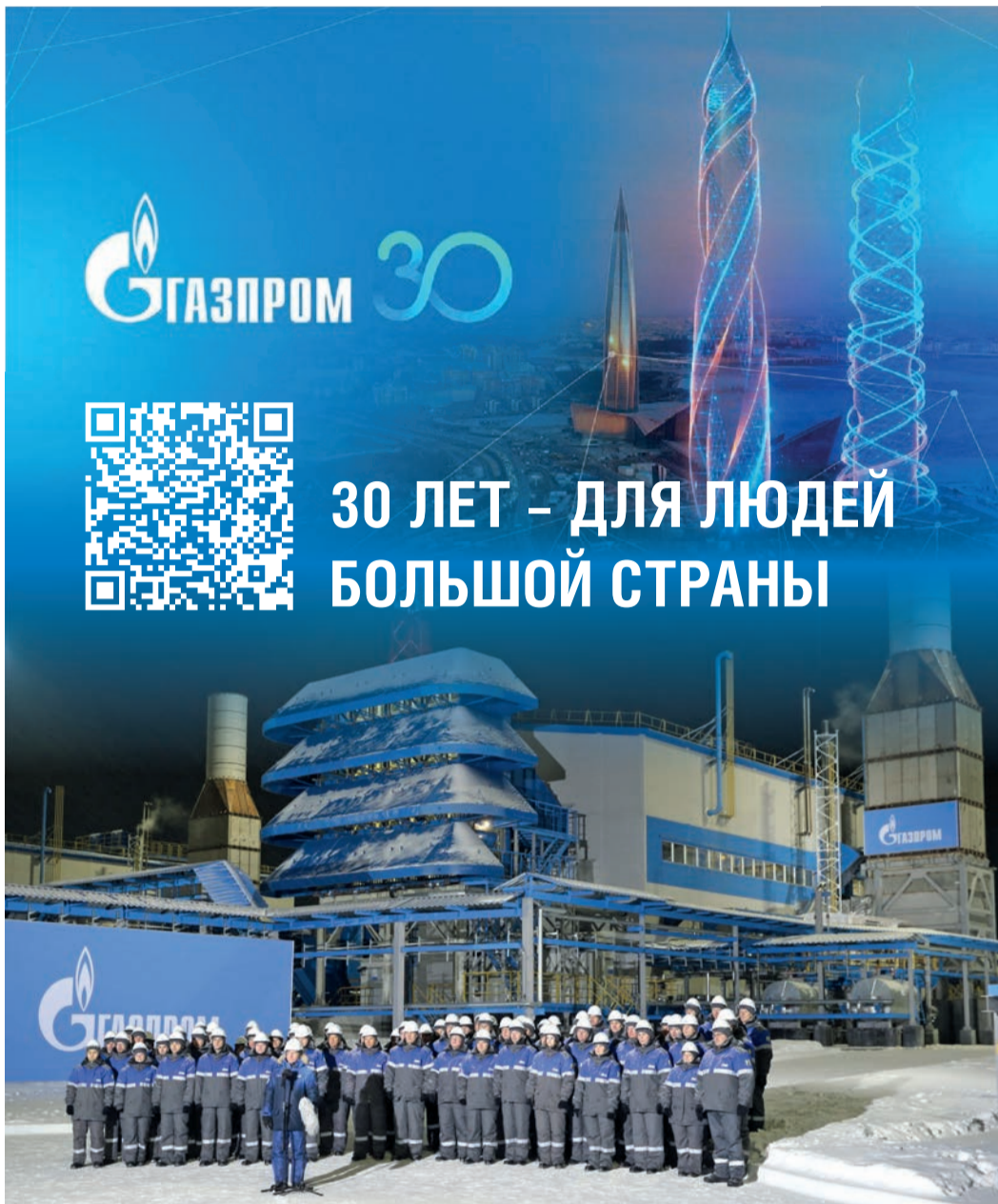
Работники ООО «Газпром трансгаз Томск» – участники праздничного митинга

17 февраля Газпром отпраздновал 30-летие. В этот день состоялось праздничное селекторное совещание под руководством Президента России Владимира Путина и Председателя Правления ПАО «Газпром» Алексея Миллера, которое транслировалось в прямом эфире на канале «Россия-24».