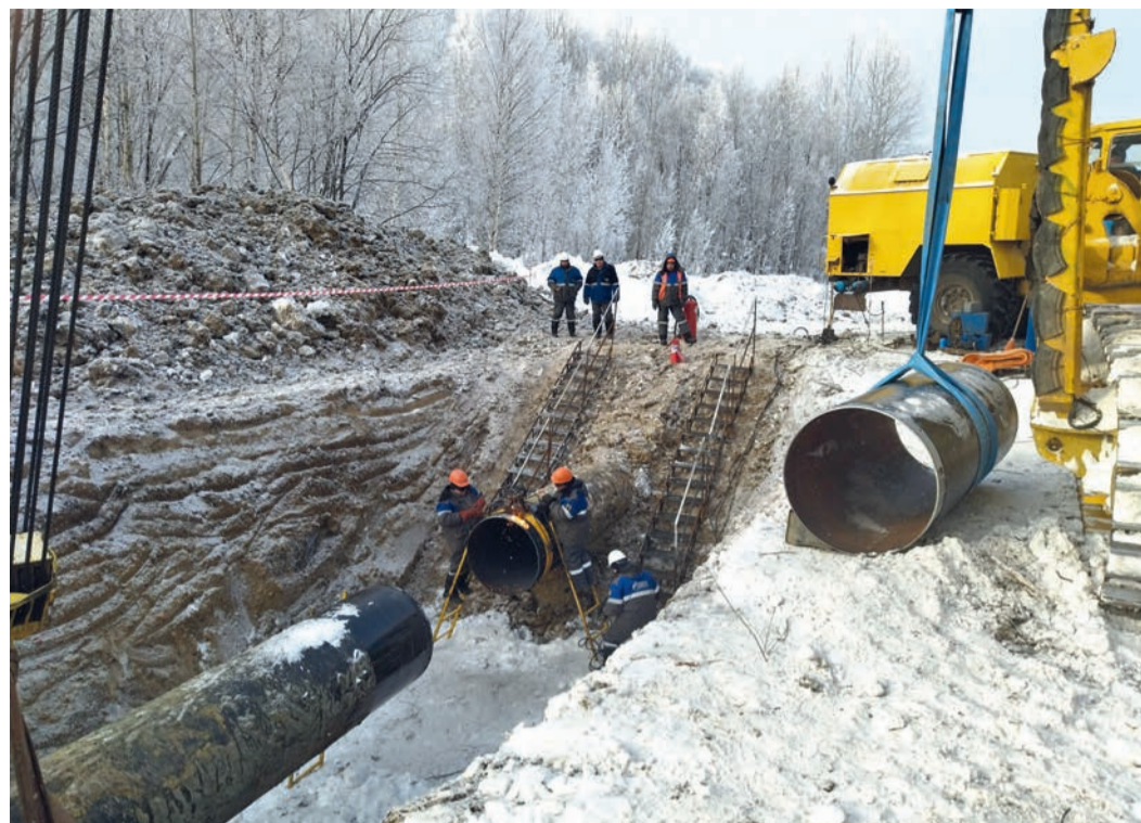
Ремонтные работы на МГ Парабель – Кузбасс в Колпашевском районе Томской области

Специалисты Чажемтовской промплощадки ЛПУМГ совместно с коллегами из УАВР завершили ремонтные работы на магистральном газопроводе Парабель – Кузбасс в Колпашевском районе Томской области. Они устранили дефекты, выявленные по результатам внутритрубной диагностики, на второй нитке газопровода.